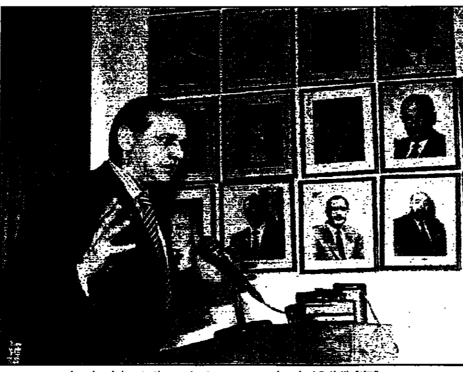
وزير الثقافة والاعلام الفلسطيني ياسر عبد ربه يتحدث في مؤتمر صحفي في عمان

وقال نتنياهو امس الثلاثاء ان الجهود التي تبذلها اسرائيل لاجل التوصل الى تسوية نهائية مع الفلسطينيين ستفشل ما لم تتخذ اسرائيل خطوات ملموسة نحو وقف عمليات الاستيطان في الضفة الغربية.